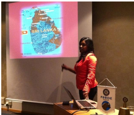
Sri Lanka – land og folk

Godt fungerende programmer er et viktig fundament i den daglige driften av klubben.