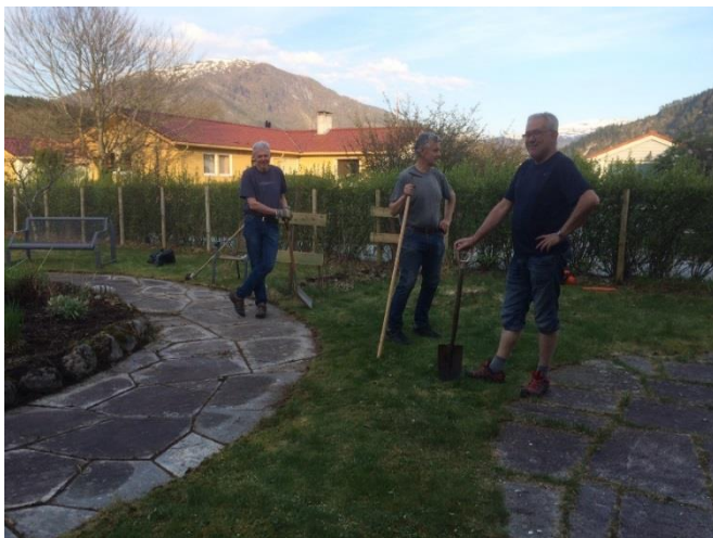
Dugnad i Sansehagen

Tilbakemeldinga fra Helsetunet viser at de setter stor pris på den innsatsen klubben gjør.